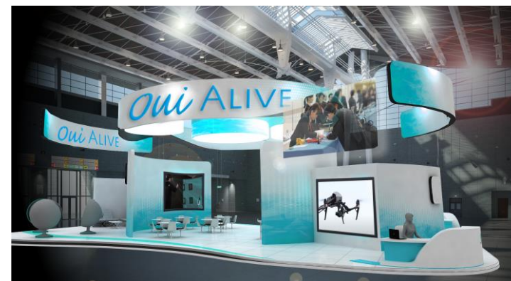
3Dエアー展示イメージ

場所も選ばず、構造上の問題もなく、費用面も問題ないため描いた夢をそのまま実現することが可能となります。絵、パーツイメージが3D化、ゲーム性をもたせ話題コンテンツを作ることも可能で、いままでにない常識を再現できます。